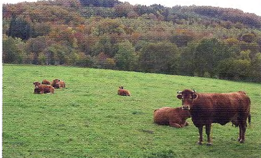
Les Limousines dans la prairie