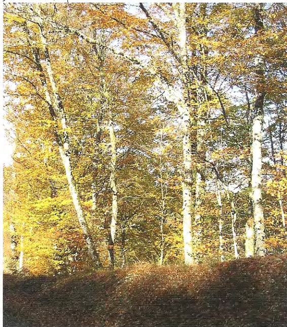
Le Bois de Tempêtier

monte des Maisons vers Le Petit-Paris à hauteur de l'étang des Maisons. Poursuivre à gauche sur la large piste montant au Petit-Paris.