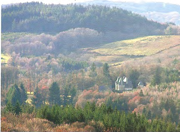
Panorama de Tarnac vu de la piste

feuillus, au croisement d'une autre piste, continuer tout droit jusqu'à la hêtraie ; suivre l'allée pour aboutir devant la maison de Lafage