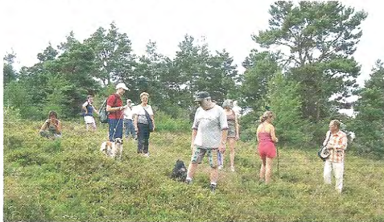
Légende du balisage