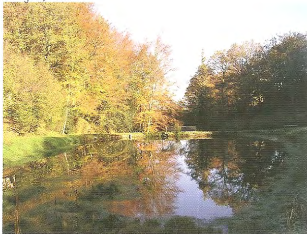
Étang de Lacombe

Murat (site d'un ancien château des Comborn) : point de vue