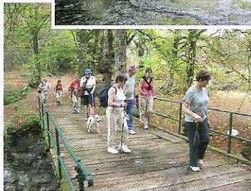
Des randonneurs au Pont Lagorce