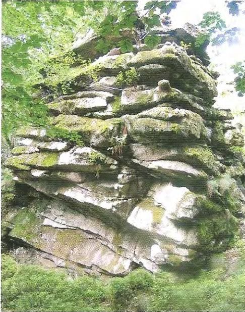
Les rochers de Servières

Magnifiques bois de feuillus, la Vienne : ses vieux moulins, ses rochers remarquables, la Chandouille et « ses planches ».